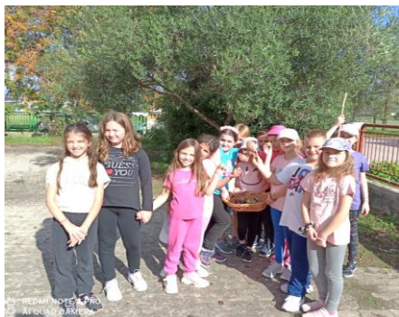
Ράβδισμα και συγκομιδή από τους μαθητές της Γ' τάξης

ΚΑΛΛΙΕΡΓΕΙΑ: Την άνοιξη που η φύση ξυπνά από τον λήθαργο η ελιά χρειάζεται λίπανση και κλάδεμα. Το ξηρό και ζεστό κλίμα του καλοκαιριού, η ελιά έχει ανάγκη από πότισμα και προσοχή, καθώς την εποχή αυτή δέχεται επιθέσεις από τον δάκο. Το φθινόπωρο ο καρπός της ελιάς είναι έτοιμος να απορροφήσει όλα τα θρεπτικά συστατικά από το έδαφος, γι' αυτό και το φθινόπωρο γίνεται και η κατάλληλη προετοιμασία του εδάφους.